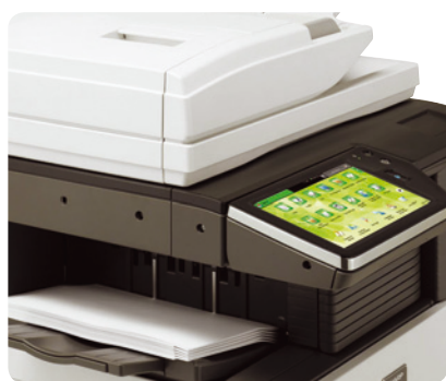
Finisher interno salva-spazio opzionale

Infatti puoi scegliere un Finisher interno salva spazio per una semplice fascicolazione e pinzatura, o tra due finisher con diverse capacità di output, per la pinzatura a sella fino al formato A3W che ti consentono di creare dei libretti o forare i documenti.