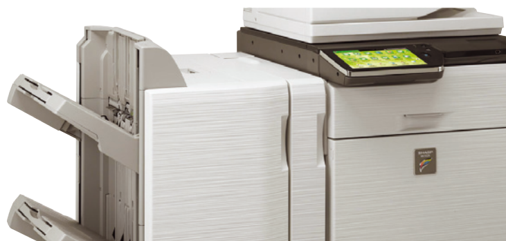
Finisher con capacità di output 4.000 fogli opzionale