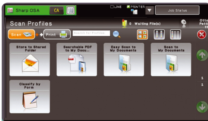
Sharp OSA Network Scanning Tool: scansione sul PC con un solo tasto