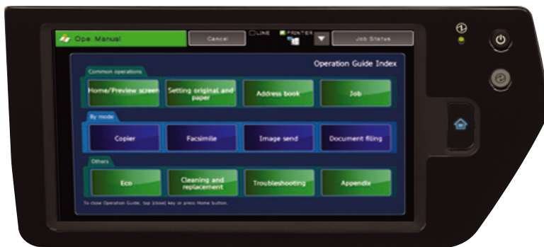
Accesso al manuale utente direttamente dal display