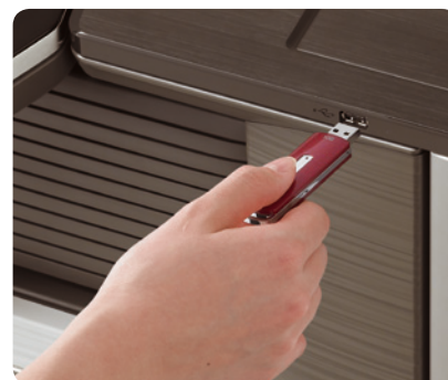
Due porte USB disponibili per una stampa veloce da chiavetta

Ogni utente può avere un display iniziale personalizzato, per un accesso rapido agli strumenti e alle applicazioni più frequentemente usate e con una scelta di sette stili diversi per lo sfondo.