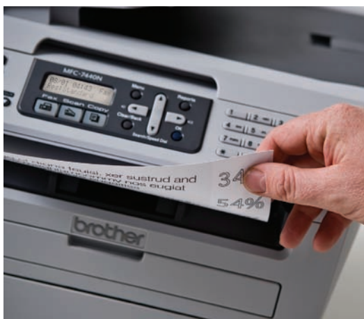
Stampa in monocromatico veloce e di alta qualità.

Visitare il sito http://solutions.brother.com per ulteriori informazioni.