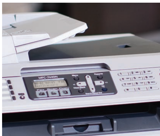
ADF – ideale per inviare fax, copiare o scansionare documenti composti da più pagine.

Oltre alle funzioni già descritte, MFC-7440N offre molti vantaggi anche in modalità "Copia".